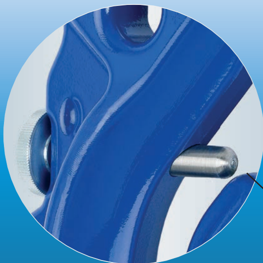
Locking Pin acc. DIN 5692

THIELE GmbH & Co. KG Werkstr. 3 · 58640 Iserlohn · Germany THIELE.de · hebetechnik@THIELE.de